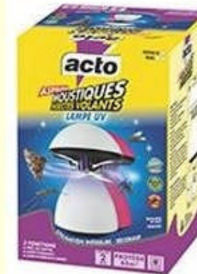
(réf. JELLY1 ) Lampe pour 80 m 2